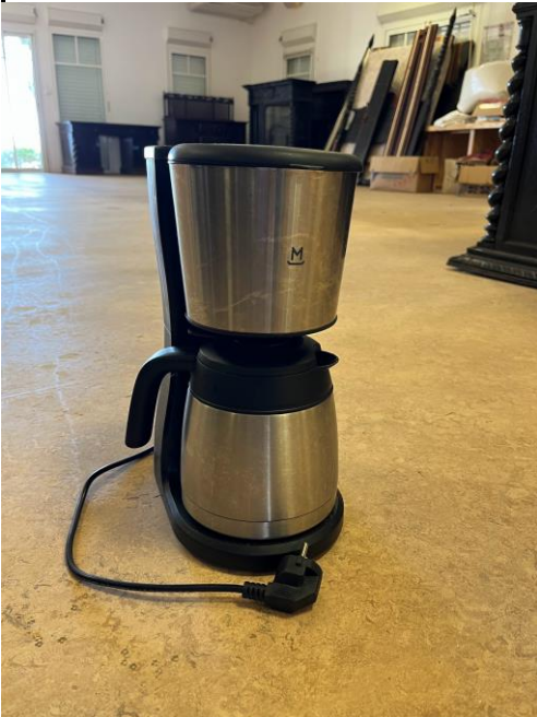
Cafetière (Coffee maker)