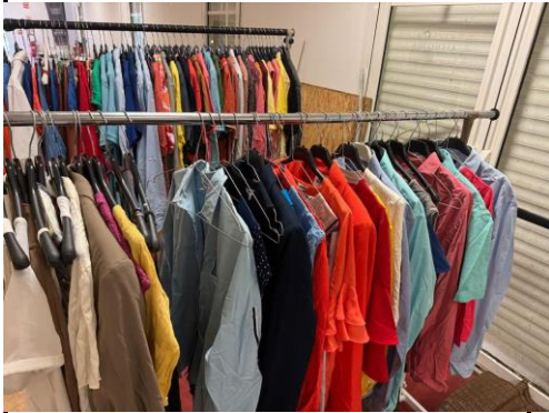
Portants à roulette ( Clothes rail )