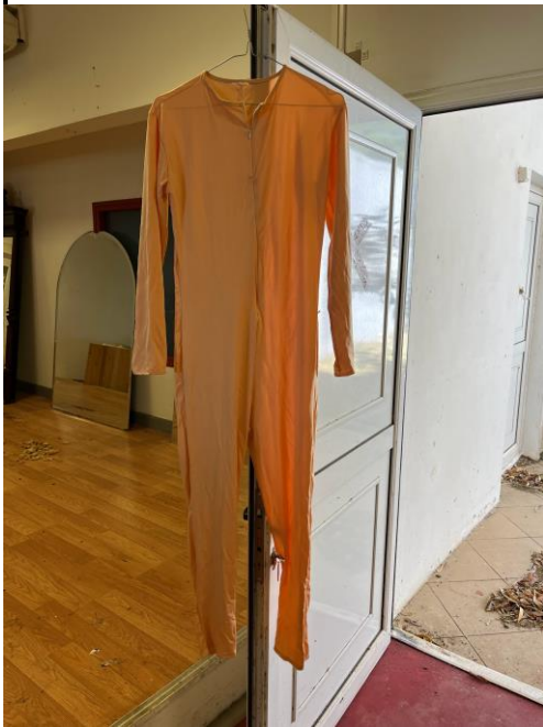
Combinaison couleur chair ( Jumpsuit )