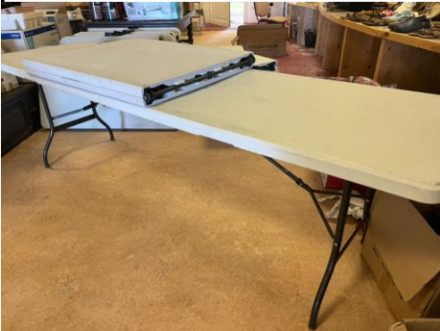
Table pliantes ( Folding table )